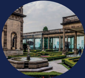
Castillo de Chapultepec Bosque de Chapultepec I Secc, Miguel Hidalgo, 11580