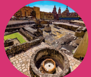
Museo Templo Mayor Seminario 8, Centro Histórico