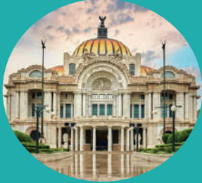
Palacio de Bellas Artes Av. Juárez S/N, Centro Histórico