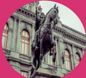
Museo Nacional de Arte C. de Tacuba 8, Centro Histórico