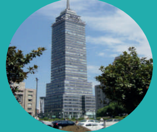
Torre Latinoamericana Eje Central Lázaro Cárdenas 2, Centro Histórico