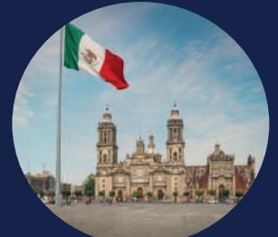
Plaza de la Constitución Pza de la Constitución S/N, Centro Histórico