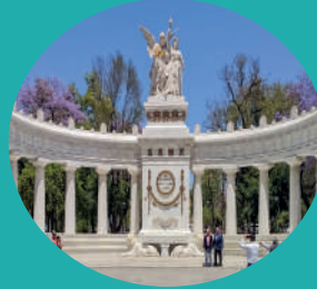
Hemiciclo a Benito Juárez Av. Juárez 50, Centro Histórico