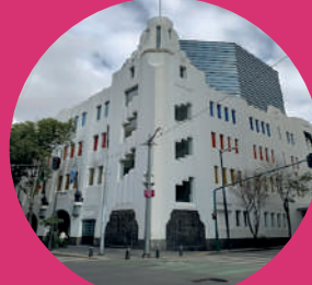
Museo de Arte Popular Revillagigedo 11, Colonia Centro