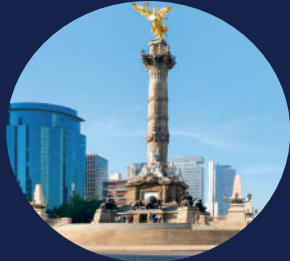
Monumento a la Independencia Av. Pº de la Reforma, Juárez, Cuauhtémoc