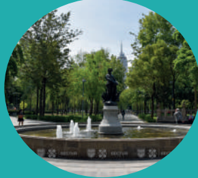
Alameda Central Av. Hidalgo s/n, Centro Histórico