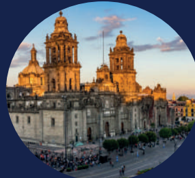
Catedral Metropolitana Pza de la Constitución S/N, Centro Histórico